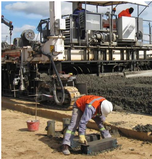
Figura 4. Moldeo de probetas prismáticas en obra.