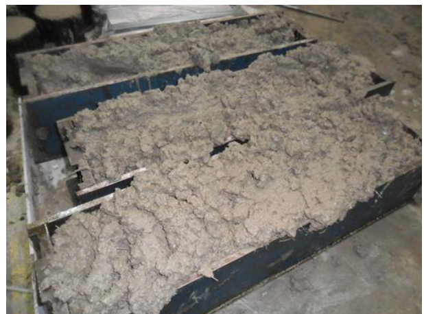
Figura 3. Moldeo de probetas prismáticas.

Armarse el molde, sellando las juntas de ser necesario, y aceitar las caras internas del mismo con una fina película de aceite mineral. El moldeo debe realizarse de forma que la longitud de la probeta fabricada sea paralela a la mesada de trabajo, tal como se muestra en la Figura 3.