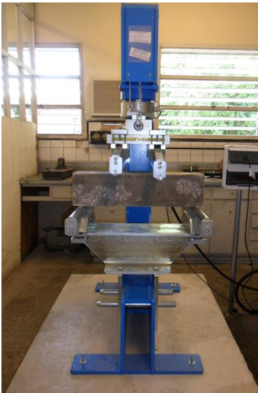
Figura 1. Máquina de ensayo para la determinación de resistencia a la tracción por flexión.

Por otro lado, los esfuerzos de tracción son los responsables de la generación de fisuras, aún en solicitaciones de compresión. Esto ocurre porque siempre que una pieza se somete a una carga compresiva en alguna dimensión, tiende a traccionarse en otra, como consecuencia de la deformación sufrida.